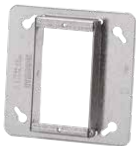
BC52C49-1/2 à CI52-C-51-2