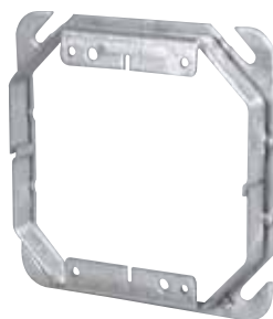
52 C 52 1/2 à 52 C 54 2