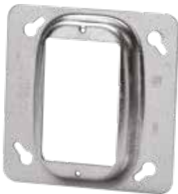
CI52-C-10 to CI-52-C-62